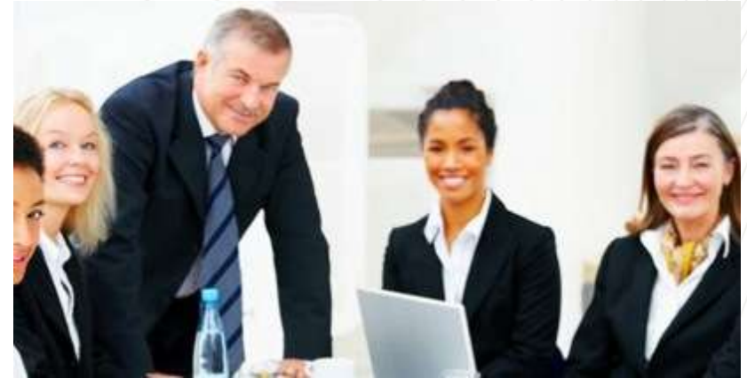
PKF México es una empresa de servicios de consultoría fiscal, legal, financiera y de auditoría y contabilidad que por más de 30 años ha venido consolidándose como una firma con una importante imagen en el ámbito de los negocios